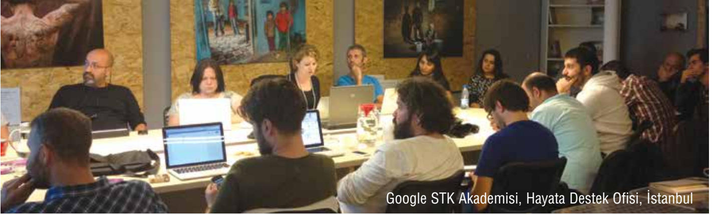
Google STK Akademisi, Hayata Destek Ofisi, İstanbul

Hayata Destek, Mahalle Afet Gönüllüleri Vakfı (MAG) ve Mavi Kalem Sosyal Yardımlaşma ve Dayanışma Derneği'nin afet risklerinin azaltılması, afet müdahalesi çalışmalarının etkinliğinin ve verimliliğinin artırılması için bir araya gelerek oluşturduğu Sivil Toplum Afet Platformu (SİTAP) çalışmalarına devam ediyor.