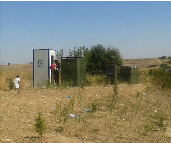
Otoban Kampı Dış Tuvaletler