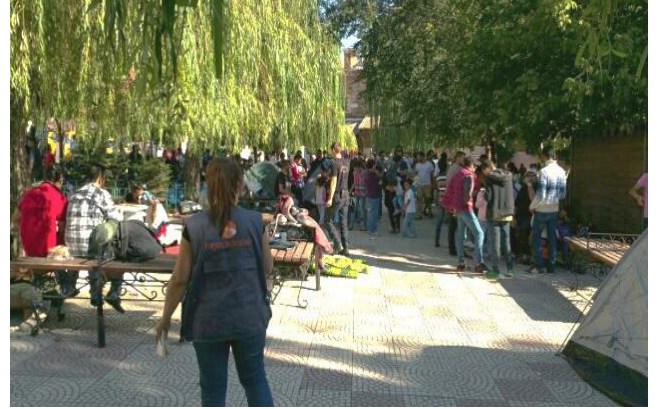
Şehir Merkezindeki Antik Park