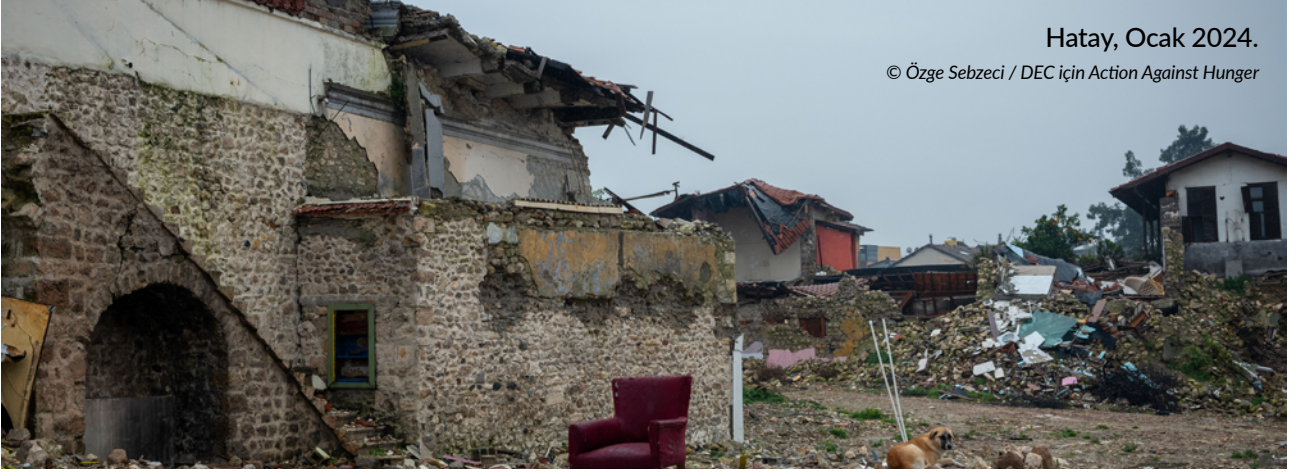
Hatay, Ocak 2024.