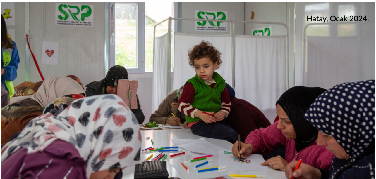
Hatay, Ocak 2024.