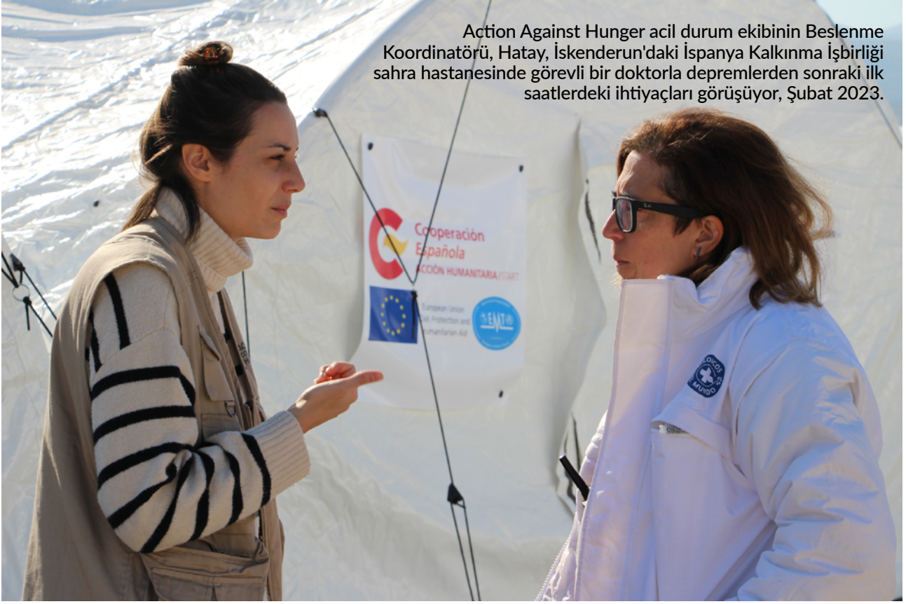
Action Against Hunger acil durum ekibinin Beslenme Koordinatörü, Hatay, İskenderun'daki İspanya Kalkınma İşbirliği sahra hastanesinde görevli bir doktorla depremlerden sonraki ilk saatlerdeki ihtiyaçları görüşüyor, Şubat 2023.